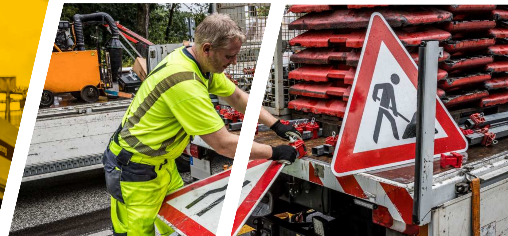
Auf der A 111 bei Berlin wurde der Abschnitt zwischen Rasthof Stolpe und der Zufahrt Schulzendorfer Straße saniert