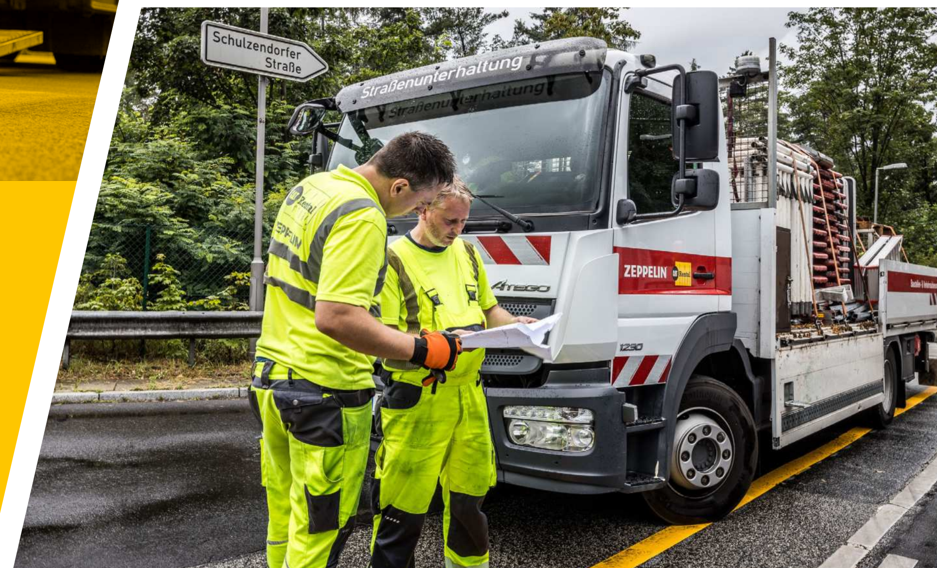
Zeppelin Rental plante und errichtete die notwendige Verkehrssicherung

Allein 11.000 Meter Markierungsfolie wurde von dem Team auf der Fahrbahn angebracht