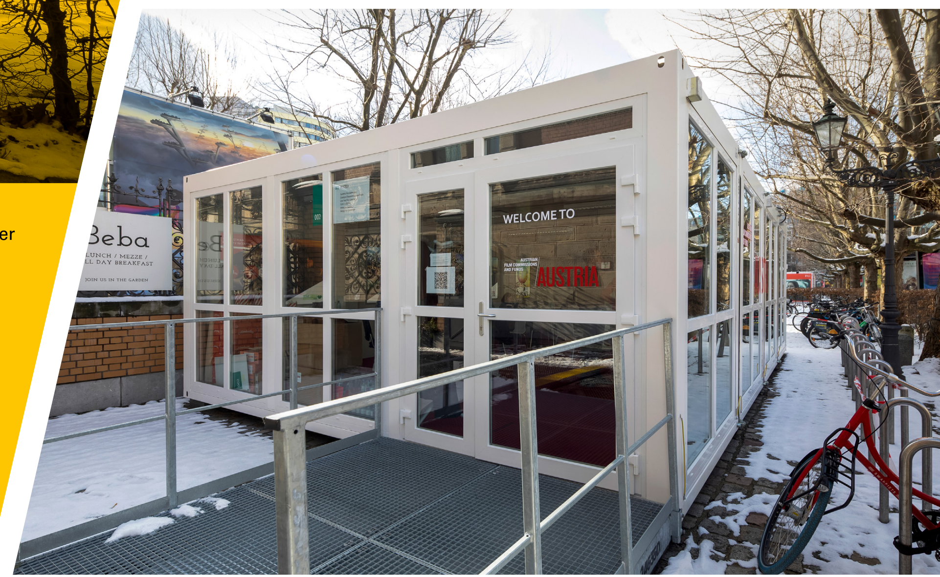
Die Austria Konferenz erhielt ein verglastes Vierermodul mit integrierter Wärmepumpe

Drei Doppelmodule wurden für die Anlage Elle Driver verbaut. Das Mobiliar im Innenbereich wurde kundenseitig gestellt, was Zeppelin Rental auf Wunsch ebenfalls übernimmt