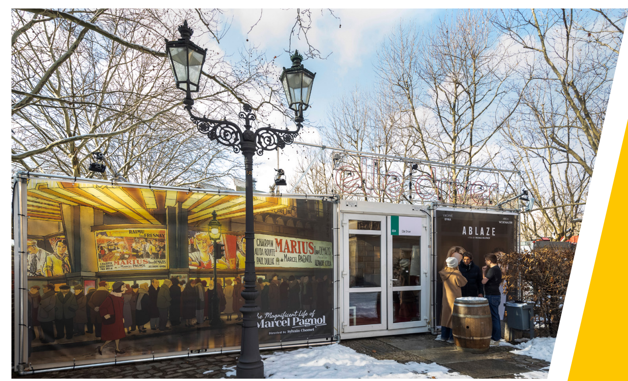
Die verwinkelte Anlage Match Factory ist teilweise verglast und umfasst 145 Quadratmeter

Drei Doppelmodule wurden für die Anlage Elle Driver verbaut. Das Mobiliar im Innenbereich wurde kundenseitig gestellt, was Zeppelin Rental auf Wunsch ebenfalls übernimmt